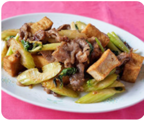
牛肉と厚揚げ、 セロリのオイスター みそ炒め