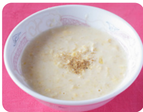
かき玉コーンスープ