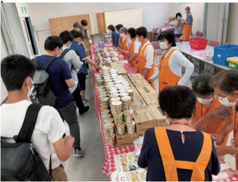
20年10月と21年4月に山形大学小白川キャンパスで行った「山形大学生 元気100倍!応援パントリー」。商品を手渡す場には多くの組合員が参加し、「こちらが元気をもらった」という声が多く上がりました。

生協共立社（山形県。以下、共立社）では、2020年3月から年に2回、宅配の仕組みを利用してフードドライブを行っています。集まった食品は、地域の福祉団体の他、コロナ禍でアルバイト収入が減少するなど生活に困っている県内の大学生に提供しています。フードドライブは家庭にある食品の余剰分を寄付として