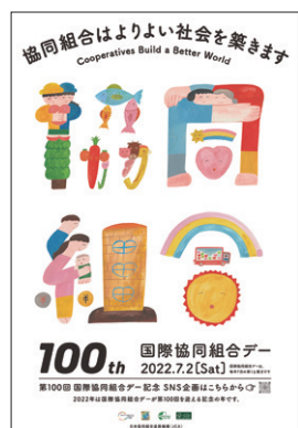
第100回国際協同組合デーポスター

今年の記念中央集会は「協同組合のアイデンティティを学び・活かす」をテーマに、協同組合のアイデンティティ(定義・価値・原則)について理解を深めました。動画の学習資料を視聴したのち、3名の協同組合関係者から事例報告があり、続いてパネルディスカッションが行われました。事例報告では、JAおちい