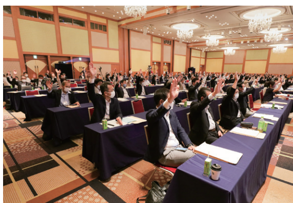
日本生協連 72回通常総会の様子。全議案を賛成多数で可決しました(関連記事はP2を参照)