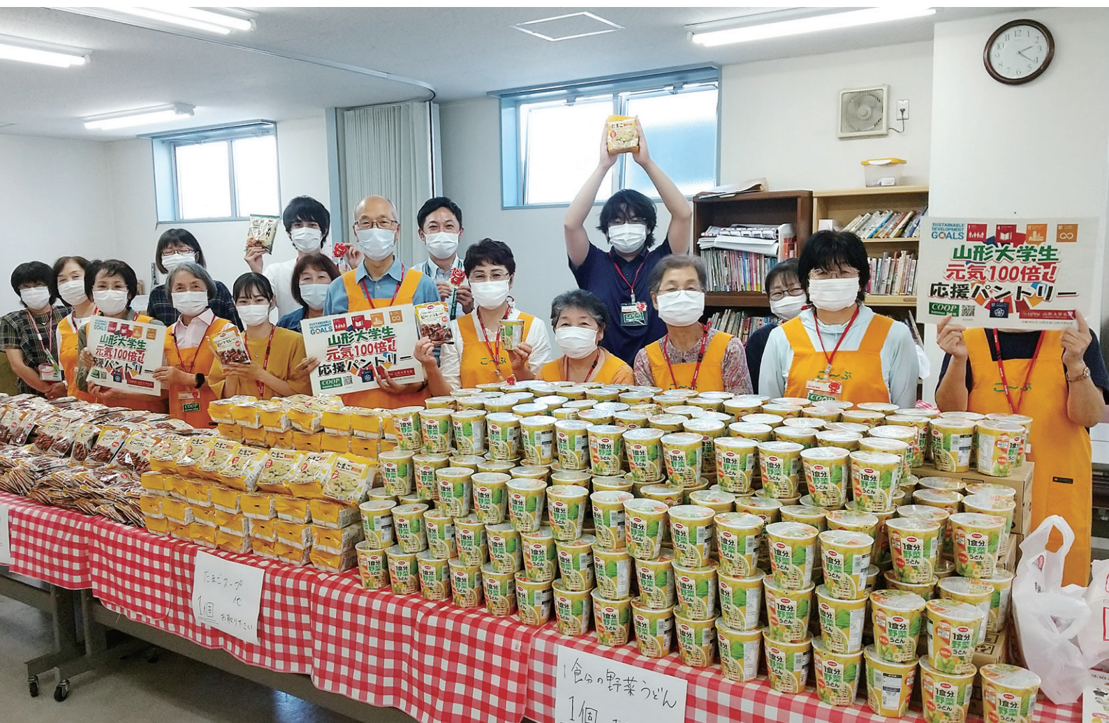
生協共立社は、大学生協と協力し「山形大学元気100倍!応援パントリー」を実施しました(関連記事はP4を参照)