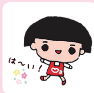
新作したラブリコLINEスタンプ（一例）