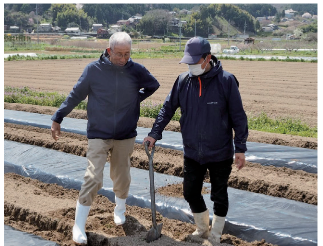
農業事業に派遣されたならコープの職員(右)が農業の研修を受ける様子

包括協定締結式の会場で、五條市の太田好紀市長は「日本の人口が減少する中において、農業は大変重要な役割を担っており、今やるべきこと