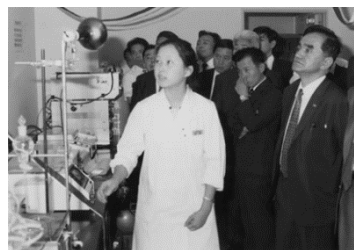
日本生協連に 「商品試験室」開設（1972年）

日本生協連は、今後も組合員の暮らしに寄り添いながら、全国の生協とともに助け合いの組織として、誰もが笑顔で暮らすことができる持続可能な社会の実現を目指してまいります。