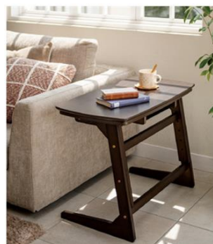
「一人用デスクこたつ（掛けふとん付き）」の デスクのみの使用例

「くらしと生協」は組合員の声を商品企画につなげています。今後もくらしを上手に工夫し、毎日をちょっとずつ新しくしていく商品を紹介してまいります。