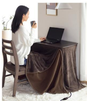
「一人用デスクこたつ（掛けふとん付き）」

定番のこたつとして思い浮かぶのはちゃぶ台のような形状にカバーをかけたもの。しかし「大きすぎる」や「低すぎる」という理由で使用をやめてしまったという方もいました。そのような方のために『ダイニングテーブルの高さで』『自分だけのひざ元を』『作業もできる天板の広さで』というこたつをご用意しました。冬はこたつに、夏はミニデスクとして使用できます。