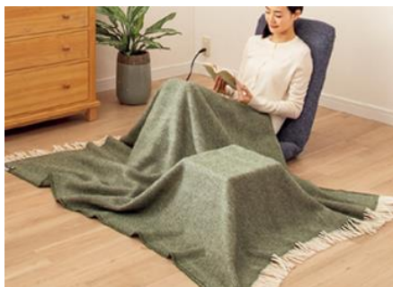
「一人こたつ」使用例

その昔「あんか」や「置炬燵（おきごたつ）」と呼ばれていた火入れして温まる道具をヒントに、電気と木枠で再現され、まさに一人一人を温めるパーソナル暖房として注目を浴びています。部屋全体を温めるよりも自分だけを温めた方が電気代を抑えられ、1時間当り約 1.4 円（強）、約 0.6 円（弱）とリーズナブルです。