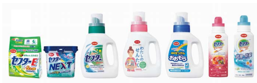
キャンペーン対象商品の例

「コープの洗剤環境寄付キャンペーン」は、環境に配慮したコープの衣料用洗剤の普及と環境保護に貢献することを目的とした取り組みで、対象商品を1点ご購入いただくごとに1円を寄付金として積み立て、NPO 法人ボルネオ保全トラスト・ジャパン「ボルネオ緑の回廊」プロジェクトや、国内外の環境保護団体に寄付するものです。