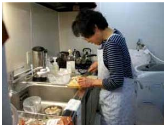
食事づくり（京都生協）