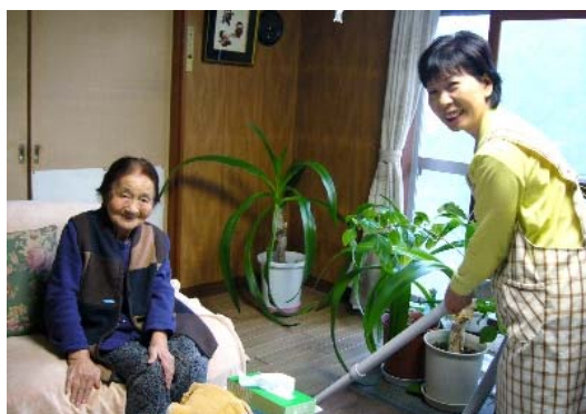
部屋の掃除（コープさっぽろ）