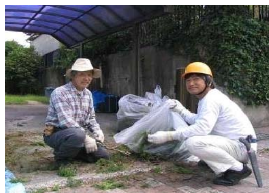
庭の手入れ・草取り（コープしが）